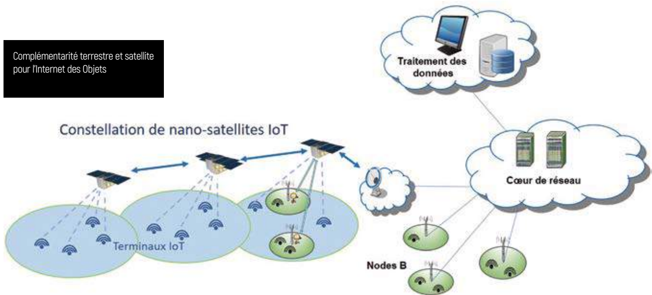
Complémentarité terrestre et satellite pour l'Internet des Objets

De la même manière, les services satellites mobiles (MSS) utilisent aujourd'hui des systèmes spécifiques pour communiquer avec des véhicules terrestres, des bateaux ou des avions. Mais on peut prévoir que les futures générations de ces systèmes s'intégreront aussi dans l'écosystème cellulaire 5G pour bénéficier des énormes économies d'échelle du réseau global. ■